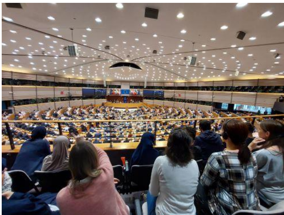
Ogled zasedanja parlamenta in glasovanja