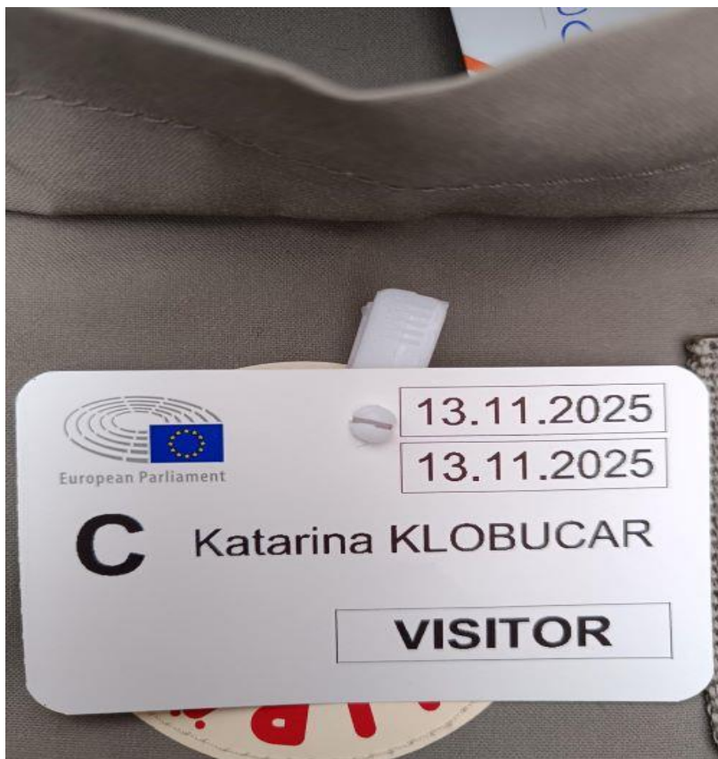
Identifikacijska kartica za obisk Parlamenta