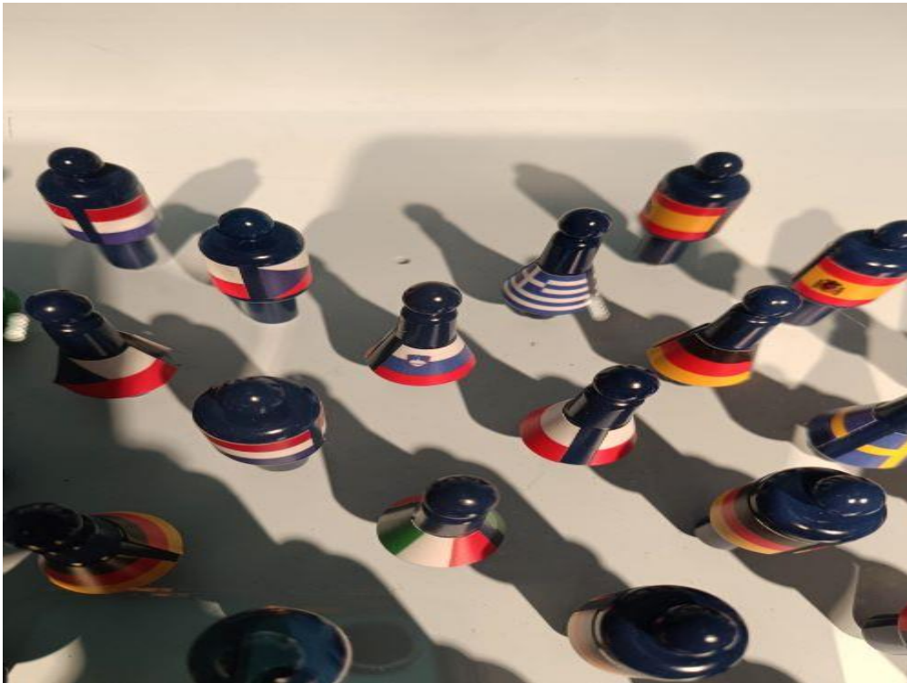
Postavitev predstavnikov držav v parlamentu EU

Naslednji dan smo že takoj po zajtrku začeli z delom. Najprej smo si ogledali Parlamentarium, center obiskovalcev Evropskega parlamenta. V prostorih se nahajajo opisi različnih dogodkov in dejanj posameznih politikov, ki so pripeljali do nastanka EU.