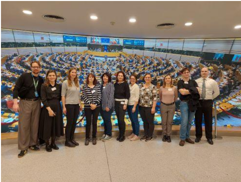
Skupinska fotografija udeležencev seminarja

Četrtek, 13.11., je bil osrednji delovni dan, v katerem smo spoznali in si pridobili največ informacij o delovanju EU. Imeli smo to srečo, da je parlament ravno na ta dan tudi zasedal in so poslanci glasovali ravno o predlogu, ki je bil v parlament poslan na pobudo nevladne organizacije iz Slovenije. Predlog je bil izglasovan. Po ogledu Parlamenta smo si ogledali še Muzej evropske zgodovine. Nato pa smo lahko odšli še po mestu. V petek, 14.11., smo se v jutranjih urah odpravili nazaj v Slovenijo. Na seminarju sem spoznala deset učiteljev in učiteljic iz različnih delov Slovenije, ki svojim dijakom, tako kot jaz svojim mladostnikom, posredujejo različne vsebine o delovanju Evropske unije. Cilj seminarja je bil, da se neposredno seznanimo s centrom upravljanja EU. Tako smo dobili vtis, kaj vse mora delovati in kaj je potrebno narediti, da takšno združenje, kot je EU, lahko deluje in je učinkovito. Seminar je bil poučen in navdihujoč. Najmočnejši vtis, ki mi je ostal, je občutek povezanosti in solidarnosti.